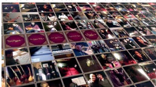
Ein Teil unserer Mitarbeiter

Wir danken allen Teilnehmern, Spendern und Unterstützern, denn jede Hilfe und alle Spenden sind Ausdruck des großen Vertrauens, das die Menschen in unsere Arbeit setzen. Sie leisten einen wichtigen Beitrag, damit wir den Opfern der Weltwasserkrise helfen können.