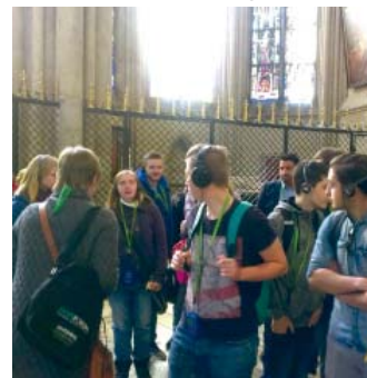
Schüler des TBS im Kölner Dom

ser Kultur- und Bildungsverein e.V. haben wir am Sonntag den 4.10.2015 mit einem Stand auf der Querstraße teilgenommen.