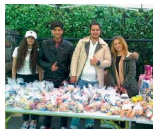
Kinderfest in Ohligs

Im Rahmen des jährlich stattfindenden Kinderfestes des Ohligs