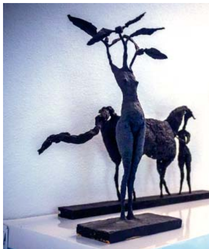
Skulpturen von Hans Lägél