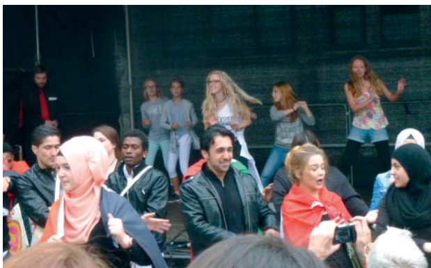
Der Flashmob in Aktion auf dem „Leben braucht Vielfalt“-Fest

Wir bedanken uns bei euch für euer herausragendes Engagement und für ein deutliches Zeichen gegen Rassismus!