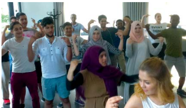
Jeden Montag üben für den Flashmob im Mehrgenerationenhaus

Alles begann mit einer kleinen Gruppe von Jugendlichen, die im Rahmen des Projektes „Nicht in meinem Namen! Gemeinsam gegen Diskriminierung, antimuslimischen Rassismus und den Missbrauch von Religion“ auf der Suche nach coolen, öffentlichkeitswirksamen Aktionen waren, die den interkulturellen Dialog anregen. Schnell war die Idee eines