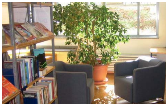
Kommunikationsbereich mit Bibliotheksatmosphäre für eine Kleingruppe

Hier können Zuwanderer ihre Deutschkenntnisse im lockeren Gespräch anwenden und trainieren. In offener Atmosphäre werden Erfahrungen ausgetauscht und neue Kontakte geknüpft. Die Freude Deutsch zu sprechen steht im Vordergrund. Hier geht es vor