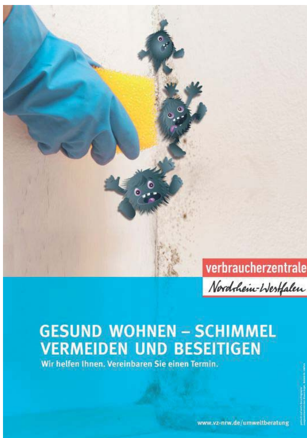
Werbeplakat der Verbraucherzentrale

Die feuchte Luft muss daher auch zum Schutz vor Bauschäden gezielt nach au-