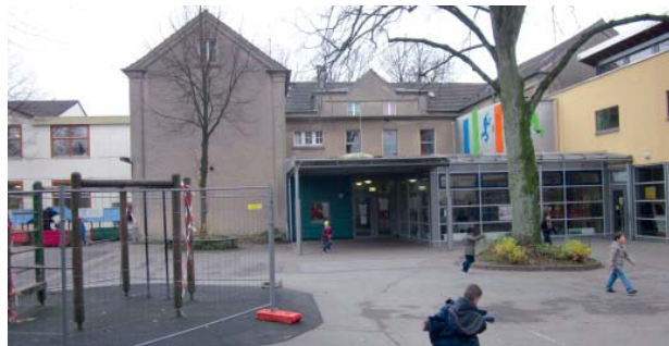
Umbau an der Grundschule Scheidter Straße

Mit dem 2. Bauabschnitt (Merianstraße – Theater und Konzerthaus) soll nach dem Weihnachtsgeschäft Anfang 2016 begonnen werden. Auch in zwischen Rathaus und Schlagbaum verschwindet der Fahrbahnsteiler, es entstehen Parkbuchten und ebenerdige Fußgängerübergänge. Die Fahrbahn erhält ebenfalls Flüsterasphalt, dessen positive Wirkung man bereits im ersten Bauabschnitt wahrnehmen kann. Der Fußgängertunnel wird geschlossen und zurückgebaut. Auch die Umgestaltung des Theaterumfeldes wird parallel für die Umsetzung vorbereitet. Neben der Neuordnung des Grünbereichs und der Verbesserung der Wegebeziehungen, sind ebenfalls ein Teil der Burgstraße, das Atrium und der vorgesehene Fahrstuhl im Theater und Konzerthaus wesentliche Bestandteile der Planung. Es wird wieder ein Baubüro mit Sprechstunden eingerichtet. Zudem setzt sich die Aktionsgemeinschaft Konrad-Adenauer-Straße für die Installation einer Weihnachtsbeleuchtung auf der Konrad-Adenauer-Straße ein, die ein positives Signal als Eingangstor zur Innenstadt senden wird.