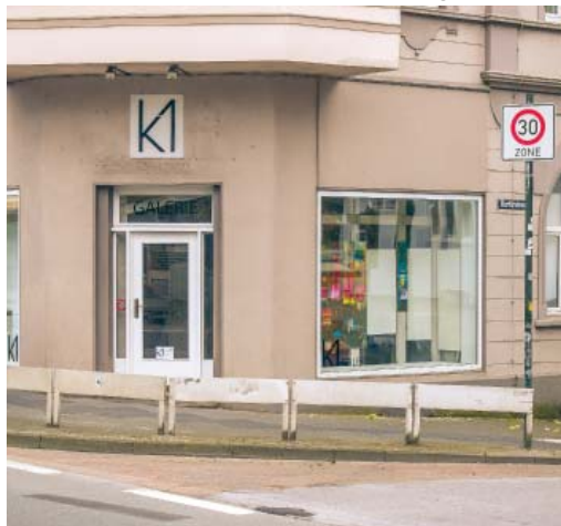
Die Galerie K1 Kurfürsten Ecke Konrad-Adenauer-Straße

Vom neuen Oberbürgermeister Tim Kurzbach wünscht er sich, dass dieser regelmäßig mit wechselnden Begleitern Spaziergänge durch die Stadt unternimmt und die Beobachtungen und die Kritik dabei notiert werden.