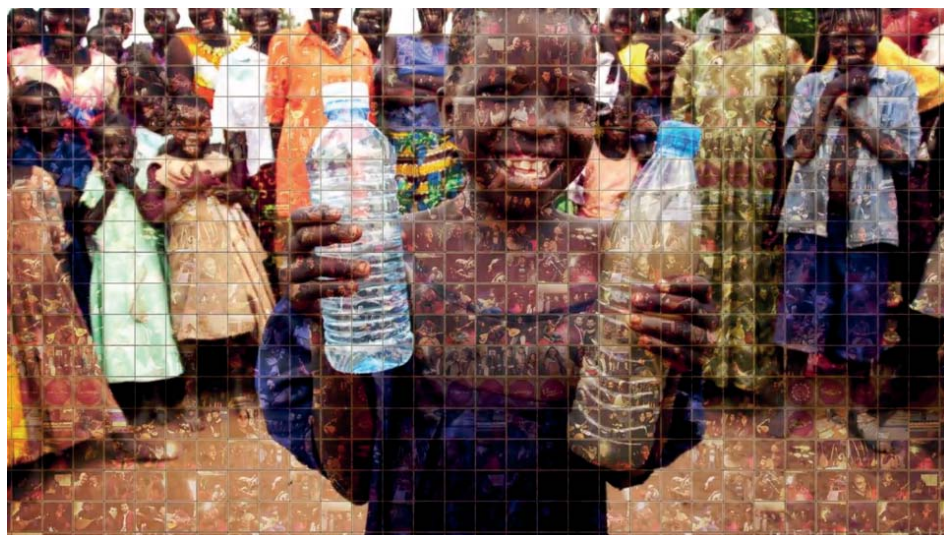
Unser gemeinsames Ziel

Das Ziel des Projektes war ist es junge Menschen alevitischen Glaubens aus ganz Deutschland mit Hilfe der alevitischen Musik zu vereinen, mit ihnen ein Musikalbum, in einer Auflage von 1.000 Exemplaren, zu produzieren und dieses gegen eine Spende von mindestens 8 Euro je CD erhältlich zu machen. Mit den ersten