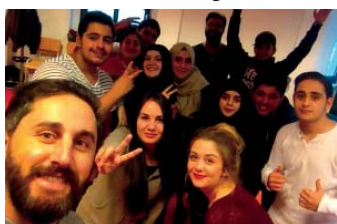
Die motivierten Mitglieder der Theater AG

(fe, ha) Seit Anfang August findet jeden Dienstag von 17 bis 19 Uhr eine Theater AG im Mehrgenerationenhaus statt. Geleitet wird die Gruppe von dem Theaterpädagogen Hüsnü Turan. Das Theaterstück beschäftigt sich mit der Vielfalt von Muslimen in unserer Gesellschaft und um eigene Diskriminierungserfahrungen aufgrund der religiösen Zugehörigkeit oder des eigenen Migrationshintergrundes. Zehn bis fünfzehn Jugendliche