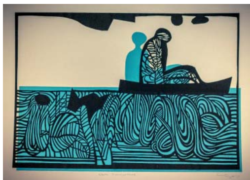
Nach Lampedusa von Hans Lägél