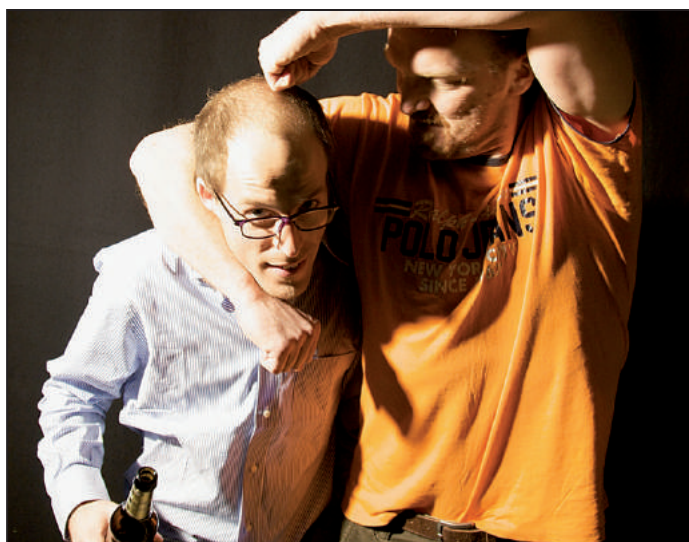
Brüder wie im wirklichen Leben