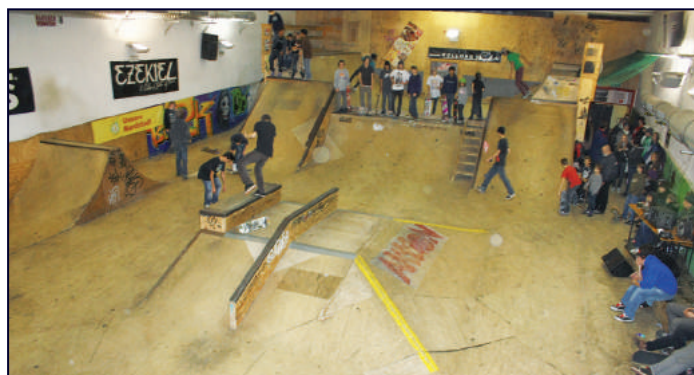
Die Halle mit den Rampenanlagen