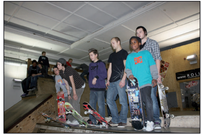
Die Skatekurse sind im Rollhaus gut besucht.