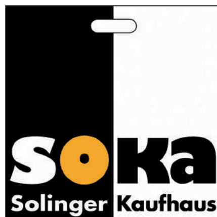
Das Logo vom SOKA

Kaufhaus wird im Stadtteil sehr gut angenommen. Im Schnitt besuchen uns ca. 300 Kunden täglich. Unsere Kunden sind Hartz-4 Empfänger, Klein-Rentner, Sozialhilfeempfänger und Studenten, aber auch Leute wie du und ich. Man merkt, dass die Menschen weniger Geld in der Tasche haben. Wenn beim Kauf die Bedürftigkeit, zum Beispiel mit der Vorlage des Solingen Passes oder des Studentenausweises nachgewiesen wird, bekommen unsere Kunden noch zusätzlich 15 % Rabatt.