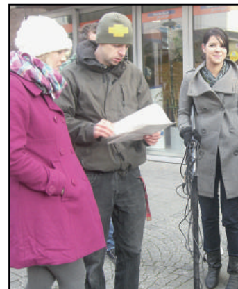
Gut organisiert konnten die Dreharbeiten in der Innenstadt beginnen

Spektakel aktorski, który przedstawiciel komitetu uczniowskiego w formie krzykliwej kłótni zagrali, był tak przekonujący, że przechodnie chcieli spontanicznie interweniować. Bardzo ładny przykład, że mieszkańcy są skłonni pomóc w potrzebie. Także dane w ankiecie pokazują, że ich większość byłaby gotowa w konfliktowych sytuacjach od razu działać, nawet fizycznie. Ważnym momentem na koniec filmu było wykazywanie