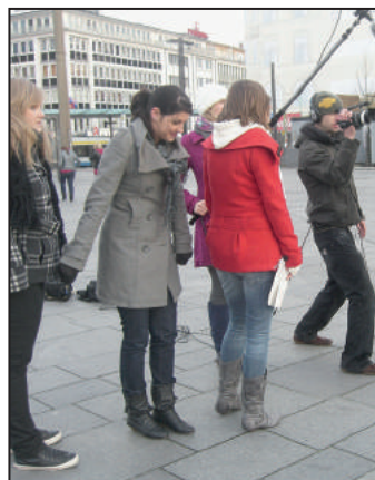
Die Dreharbeiten in der Innenstadt

der Gewalt eine Rolle spielt und Zivilcourage nötig ist, filmisch darstellen wollten. Wichtig war es uns auch, verschiedene Handlungsmöglichkeiten, die einem als „unbeteiligter Beteiligter“ in so einem Moment bewusst oder unbewusst zur Verfügung stehen, darzustellen. Weiterhin wollten wir die Meinung von Solinger Bürgern in unserem Film einbauen. Aus diesem Grund ist eine Videoumfrage in dem Film enthalten. Zu guter Letzt sollte unser Film mit einer Prise Ironie und Witz aufgepeppt werden. Am Sonntag, den 13. Dezember 2009, war es dann soweit: Mitten im Solinger Winter, bei gefühlten -20^{\circ}\text{C} , begannen die Dreharbeiten in der Solinger Fußgängerzone. Unterstützt wurden wir von dem Medienpädagogen und Filmemacher Thomas Kupper, der uns mit Rat und Tat zur Seite stand. Die Schauspielkünste bei einer Streit- sene unserer SV waren so überzeugend, dass Passanten spontan eingreifen wollten. Ein gutes Beispiel dafür, dass Mitbürger bereit sind, Hilfe zu leisten. Auch bei der Umfrage zeigte sich, dass viele Mitbürger nach eigenen Angaben in Kon-