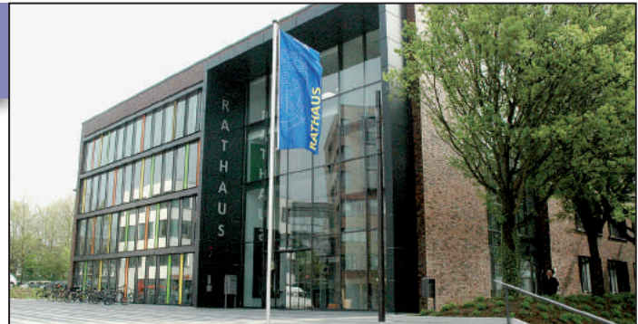
Das Solinger Rathaus

2. Familienkonzert Nach der Oper von Georges Bizet beginnt wie ein ganz normales Symphoniekonzert. Doch irgendwas ist diesmal anders, Eintritt 4 / 7,50 € Familienkarte 10,50 € Theater und Konzerthaus Konrad-Adenauer-Straße 71 Sonntag - 09.05. - 11.30 h