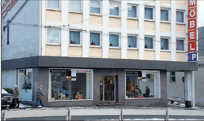
Das SOKA befindet sich im ehemaligen Gebäude des Möbelhauses Schmidt.

und Herrichtungsphase in bleibender Erinnerung geblieben, in der wir sehr viel improvisieren mussten. Zum Glück haben die Mitarbeiter alle mitgezogen. So konnten wir am 27. November planmäßig eröffnen.