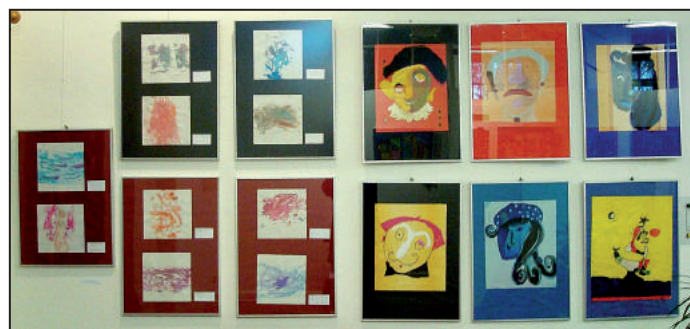
Bergische Wanderausstellung: MUS-E Bilderbogen

Ihm war es wichtig, dass sich die Menschen an Musik erfreuen: „Einige sagen, man könne ohne Musik, ohne Theater, ohne Gedichte, ohne Literatur leben. Aber das ist nicht so. Ich sage immer, von einer Musikschule