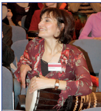
Die Teilnehmer beteiligten sich begeistert an der Trommel-Aktion zu Beginn des Kongresses

Zum vierten Mal fand in Solingen der landesweite Integrationskongress statt - unter Federführung des NRW-Ministeriums für Generationen, Familie, Frauen und Integration. Unter dem Motto „LebensArt Nordrhein-Westfalen - Integration und Kultur statt“ besuchten 450 Menschen das Theater und Konzerthaus, um sich über Kunst und Kultur als integrationsförderndes Mittel auszutauschen.