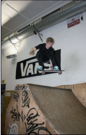
Die Jugendlichen üben an ihren Sprüngen.