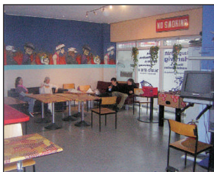
Das Jugendcafé

So konnte Anfang 2004 mit dem Umbau begonnen werden, der mit tatkräftiger Unterstützung der Solinger Jugend im Mai abgeschlossen war. Seitdem ist das Rollhaus fester Bestandteil des Solinger Jugendangebots.