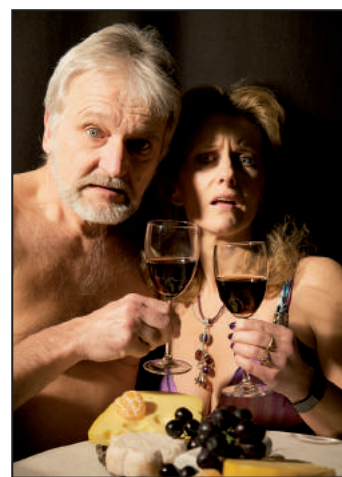
Oh, Gott, die Kinder kommen zurück!